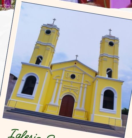
Iglesia Santo Domingo