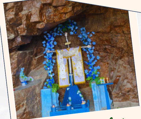
Cruz de Chalpón