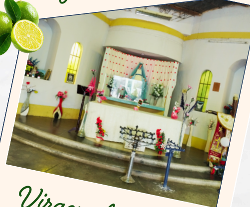
Virgen de Nitape